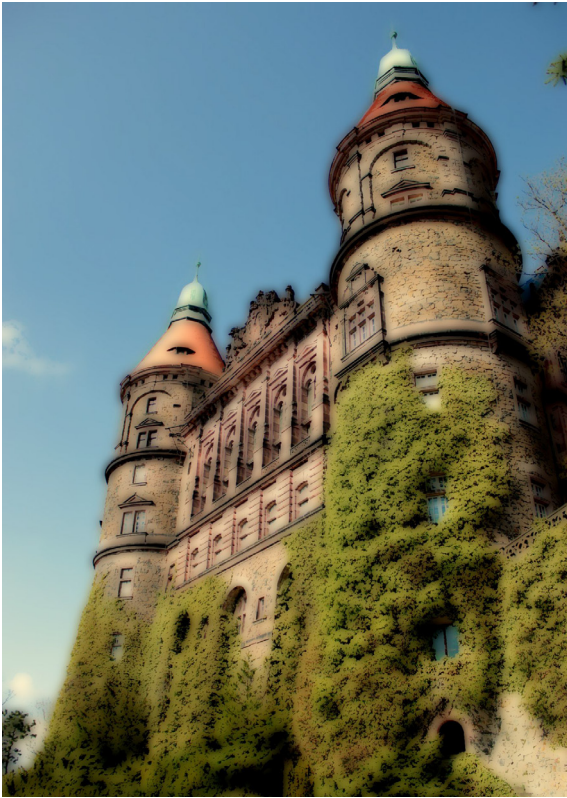
Замок Ксенж. Апрель 2012.

тине величественным местом, и около девяти тысяч служащих ежедневно обслуживали нужды его владельцев. Великолепную резиденцию Ксенж в разное время посетили многие известные гости: второй президент США Джон Куинси Адамс, прусский король Фридрих Вильгельм III, царь Николай I, император Франц-Иосиф, премьер-министр Великобритании Уинстон Черчилль.