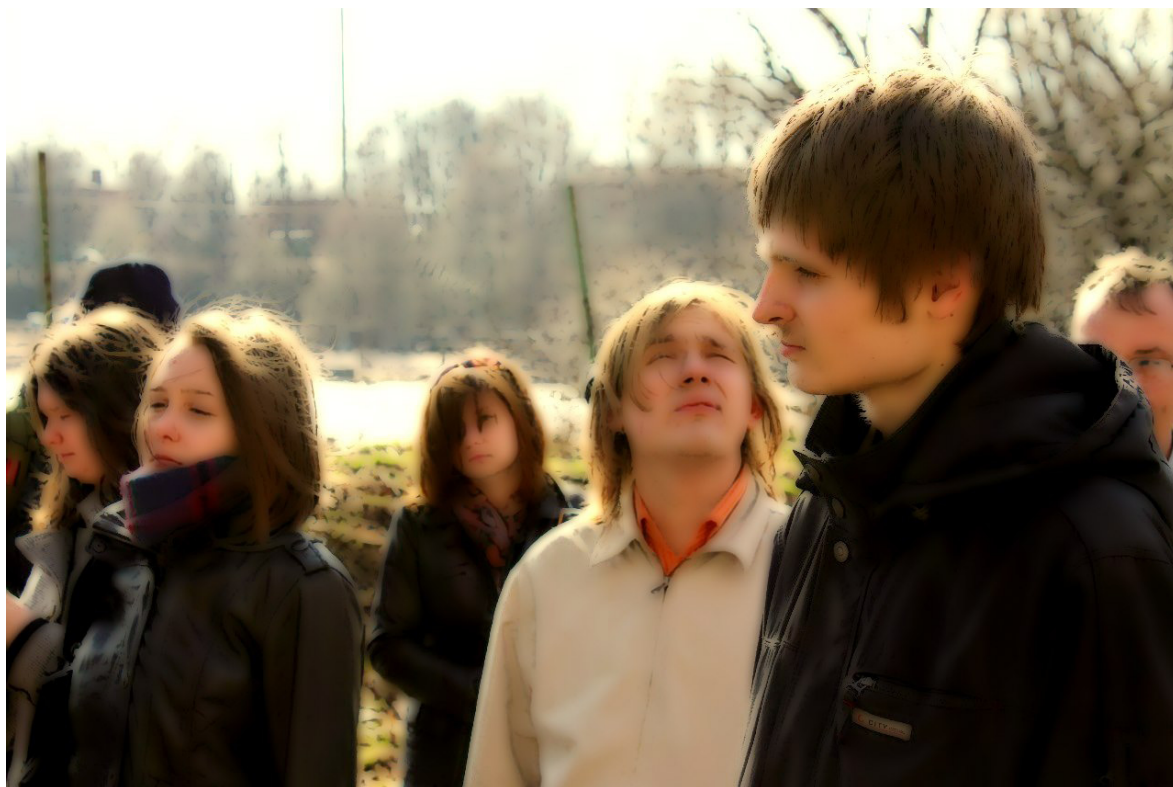
Участники конференции на экскурсии по Выборгскому замку. 28 апреля.