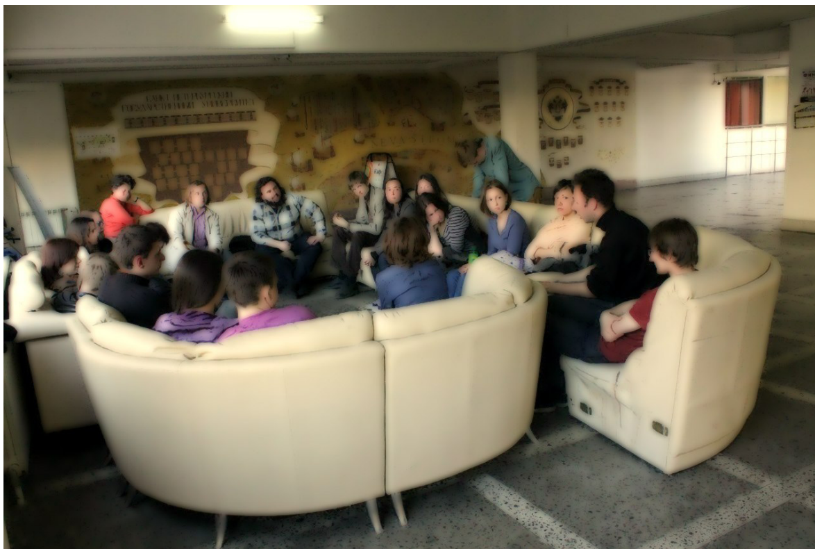
«Встреча на диванах». 30 апреля.