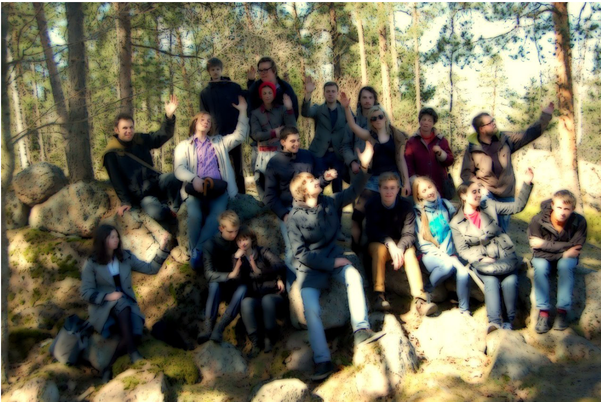
Подражание Элиасу Лённроту. Парк Монрено. 29 апреля.